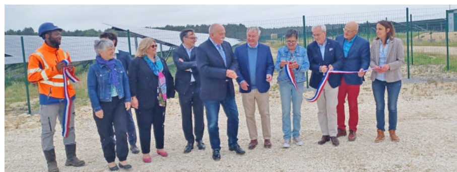
▲ Inauguration de la 3 ème centrale photovoltaïque de l'Écopôle de Marmagne dédiée à la production d'énergie renouvelable et à la valorisation des déchets issus de l'agriculture.