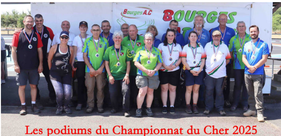
Les podiums du Championnat du Cher 2025

sident. Je suis arrivée au club en 2013 pour découvrir le tir à l'arc, puis je suis devenue entraîneuse en 2017. Depuis, ce club fait partie intégrante de ma vie. Mon souhait aujourd'hui est de poursuivre le travail déjà engagé afin que chacun puisse s'y sentir bien : progresser, performer ou simplement partager le plaisir de tirer ensemble.