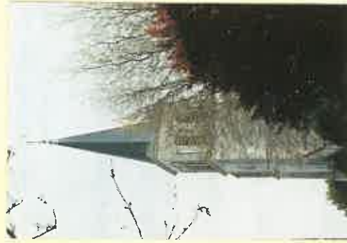
MARMAGNE, à 10 km de BOURGES